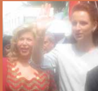
La princesse Lalla Salma et la Première dame de Côte d'Ivoire Madame Ouattara visitent le service d'Oncologie Pédiatrique de Treichville.