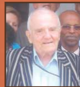
Hommage à Jean Lemerle

(POUR PLUS DE RENSEIGNEMENTS SITE WWW.GFAOP.ORG)