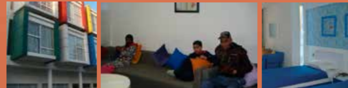
Visite de la nouvelle Maison des parents de Casablanca financée par la Fondation Lalla Salma