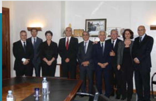
16 mai 2011. Visite d'une délégation du laboratoire GSK au siège de l'ALSC à Rabat.