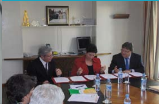
8 février 2010. Signature d'une convention avec les Hôpitaux universitaires de Genève.