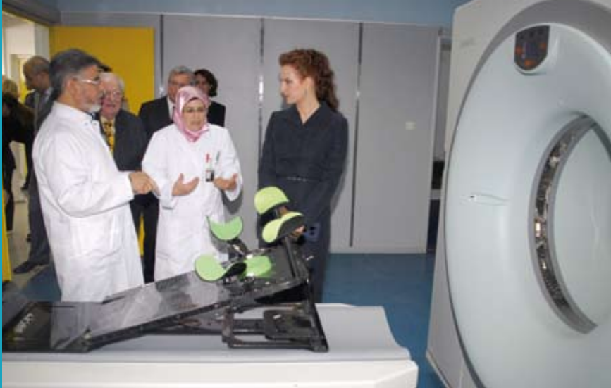
19 mai 2011. Inauguration du service de radiothérapie et des services de chirurgie et de réanimation à l'Institut national d'oncologie de Rabat.