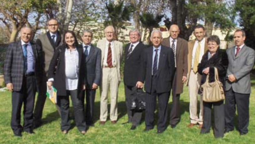
8 février 2010. Réunion du comité scientifique international de l'ALSC.