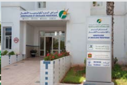
Le service de chimiothérapie de proximité de l'hôpital 20 août permet 3 000 admissions annuelles.