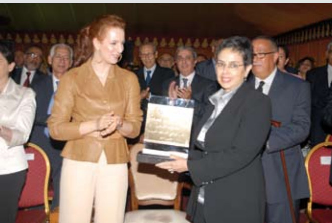
31 mai 2011. Remise du label OR «Entreprise sans tabac» à l'ONCF.