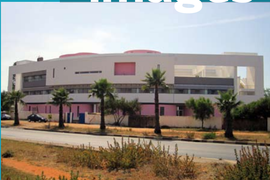
Automne 2011. État d'avancement du projet de construction du pôle d'excellence d'oncologie gynéco-mammaire de Rabat.