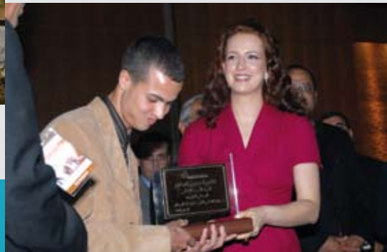
31 mai 2010. Remise du label «Lycée sans tabac» au Lycée Amira Lalla Salma, Rissani, Errachidia.