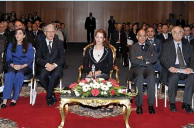
24 mars 2010. Lancement officiel du Plan National de prévention et de contrôle du cancer.