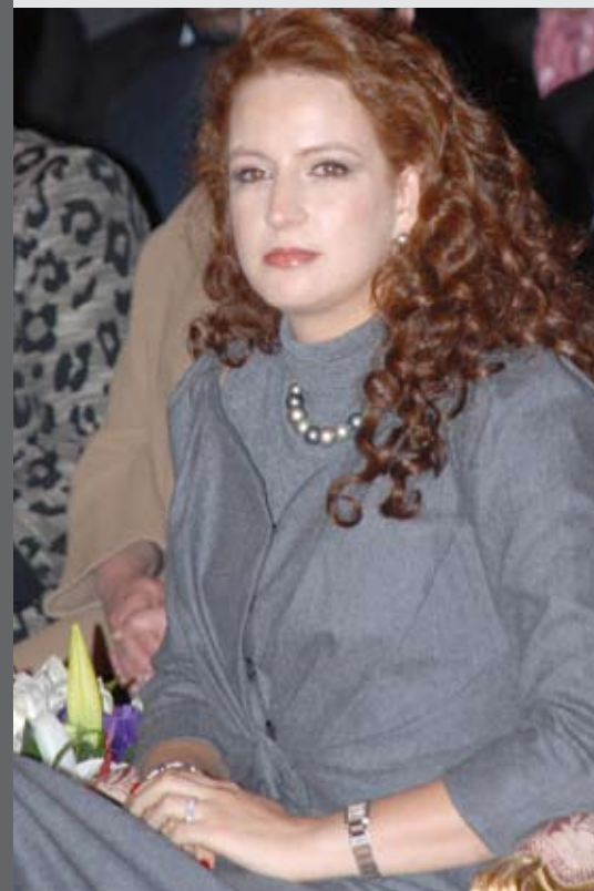
Son Altesse Royale LA PRINCESSE LALLA SALMA

Notre association restera entièrement disposée à œuvrer dans ce sens en étroite collaboration avec des partenaires de la société civile, des secteurs public et privé, à l'intérieur et à l'extérieur du Royaume. Elle est également disposée à partager les expériences qu'elle a accumulées dans ce domaine.