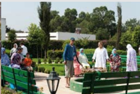
En 2010, lancement de la construction de 4 maisons de vie. Ici celle de Casablanca ouverte en 2007.