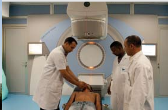
Achat et installation de quatre accélérateurs en 2010.