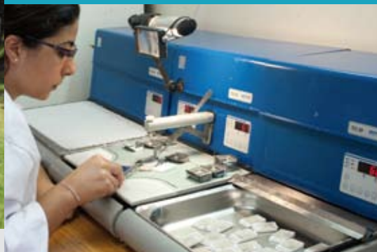
Après Agadir, Casablanca, Rabat, Oujda et Al Hoceima, le programme ACCES s'est étendu à Marrakech et Fès en 2011.