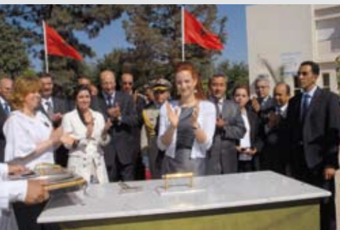
7 juin 2010. Pause de la première pierre du centre régional d'oncologie de Meknès.