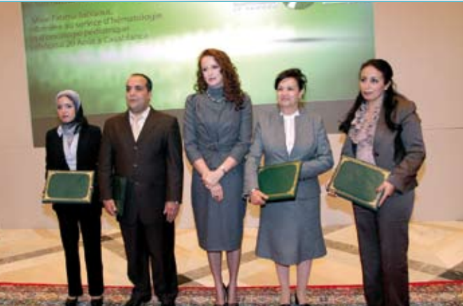
22 novembre 2011. Cérémonie de remise des attestations pour les formations financées par l'ALSC lors de l'Assemblée Générale.