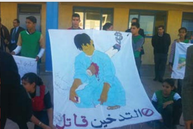
23 novembre 2010. Journée de sensibilisation sur les méfaits du tabac dans le cadre du programme CLEs au lycée Abderrahman Hajji à Salé.